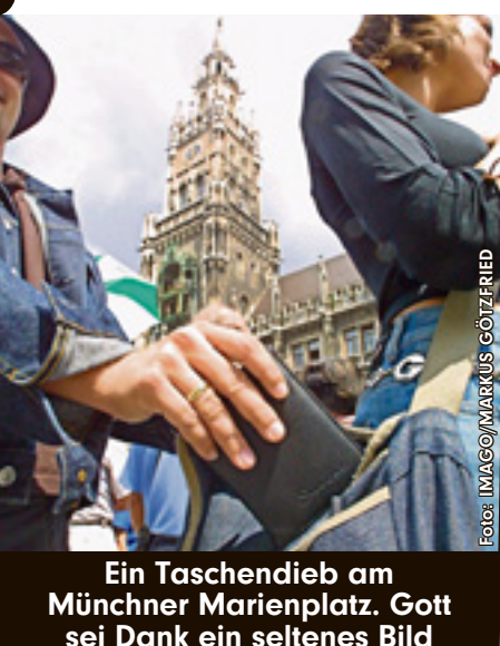
Ein Taschendieb am Münchner Marienplatz . Gott sei Dank ein seltenes Bild