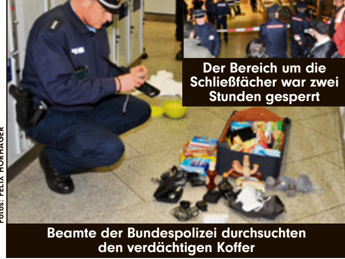
Beamte der Bundespolizei durchsuchten den verdächtigen Koffer

München - Alarm am Hauptbahnhof! Ein Spürhund schlug gegen 17.30 Uhr bei einer Routinekontrolle der Schließfächer an. Verdacht: Sprengstoff. Der Bereich um die Schließfächer und die Empore wurden sofort gesperrt , Spezialkräfte angefordert. Die Knackten das Fach - und konnten schon bald Entwarnung geben. In einem großen Koffer wurde nur eine chemische Substanz gefunden. Die war allerdings völlig legal und ungefährlich . Nach zwei Stunden wurden die gesperrten Bereiche wieder freigegeben . Zug- und S-Bahnverkehr waren nicht beeinträchtigt . Und trots des endlich harmlosen Fundes : „Der Hund hat alles richtig gemacht “, sagte ein Sprecher der Bahnpolizei .